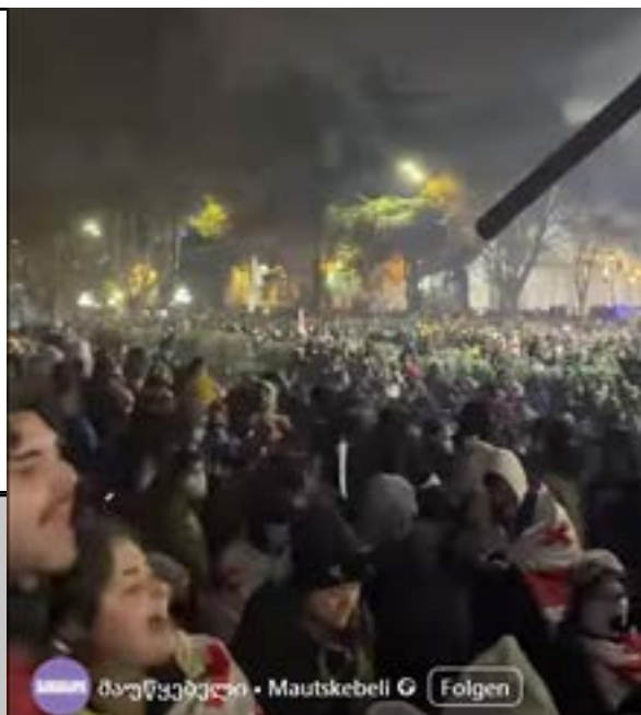
Demonstrationen in Tiflis November 2024

Beginn 19 Uhr. Eintritt frei. Gäste willkommen.