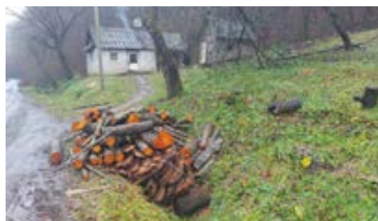
Mit Spendengeldern finanziertes Brennholz bei einer Familie im Ortsteil Simer. An der Straße ist nur noch ein Teil der gesamten Wagenladung zu sehen

Der Krieg im Osten bringt weiterhin einschneidende Änderungen für Peretschny mit sich. Mit der viel größeren Stadt Kramatorsk im Gebiet Donezk partnerschaftlich verbunden, erhält es, so traurig es klingt, durch die Umsiedlung von Betrieben und Krankenhäusern aus Kramatorsk einen bedeutenden Entwicklungsschub. Das Windenergieunternehmen „Friendly Wind Technology“ aus Kramatorsk hat sich bereits niedergelassen, große Werkshallen sind schon in Betrieb oder im Bau. Vier Windräder produzieren bereits Strom in den Kammlagen der Karpaten, wo die Windverhältnisse am günstigsten sind. Geplant ist die gigantische Zahl von 300 Windrädern, was natürlich auch bei der lokalen Bevölkerung höchst umstritten ist. Einige freuen sich über die damit verbundene Erschließung entlegener Regionen, andere befürchten zurecht die massiven Eingriffe in die Natur. Unberührte Buchenwälder mit Bären, Wölfen, Adlern sind höchst gefährdet. Die Ansiedlung von ca. 2000 Mitarbeitern aus Kramatorsk mit ihren Familien ist geplant.