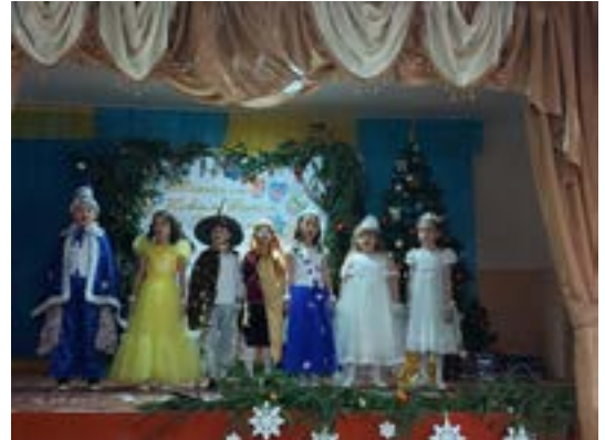
Die dritte Klasse der Dorfschule im Ortsteil Simerki führt ein weihnachtliches Märchenspiel auf.

Im Ortsteil Simerki konnte die eindrucksvolle Abschlussfeier im örtlichen Dom Kultury ungestört stattfinden. Der benachbarte Ortsteil Saritschewo mit einer viel größeren Schule dagegen hatte Pech: Dort sollte die Schlussfeier etwas später, um 12.00 Uhr, beginnen. Kurz vorher begannen die Sirenen zu heulen: Luftalarm in der gesamten Ukraine. Abbruch der Veranstaltung, im Gänsemarsch ab in die Schutzräume. Verzweiflung und Frustration bei Kindern und Pädagoginnen, die sich wochenlang auf diesen Höhepunkt des Jahres vorbereitet hatten. Aber so ist die Realität in einem Land, in dem Krieg herrscht.