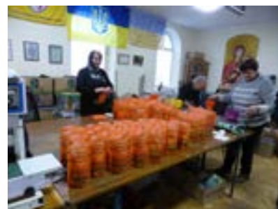
Abfüllen der Essensrationen