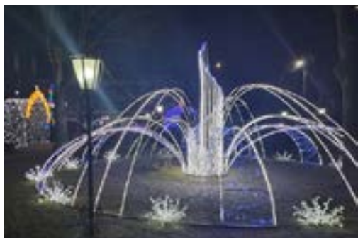
Weihnachtsbeleuchtung am Hauptplatz von Peretschny, ein Geschenk der Partnerstadt Kramatorsk