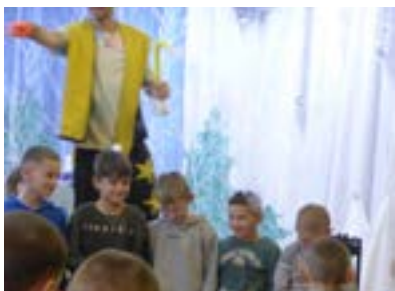
Zaubervorführung im Sozialinternat