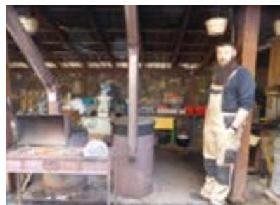
Sozialküche für Frontsoldaten

Impressum: Mitgliederzeitschrift der Bayerischen Ostgesellschaft e.V, Adresse: BOG, Edlingerpl. 4, c/o V. Schindler, 81543 München. www.bayerische-ostgesellschaft.de . Spenden- und Beitragskonto IBAN:DE14 7015 0000 0908 2302 20, sskm Redaktion: Iris Trübswetter, itruebswetter@web.de Texte: H.Hey, V. Schindler, I. Trübswetter, Alex Schwarz, Anna Schüller, Sonja Schiffers, Thomas Hummel Bilder©: Volker Schindler, I. Trübswetter, Internetfund